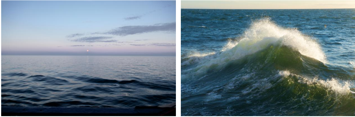
Wechselnder „physikalischer Antrieb“ – allgegenwärtig während der M87/4.

Diese Situation ist der Entwicklung der sommerlichen Blaualgenblüte augenscheinlich nicht zuträglich, und so nahm, vorbehaltlich einer späteren Quantifizierung, die Abundanz der Cyanobakterien im Arbeitsgebiet eher ab.