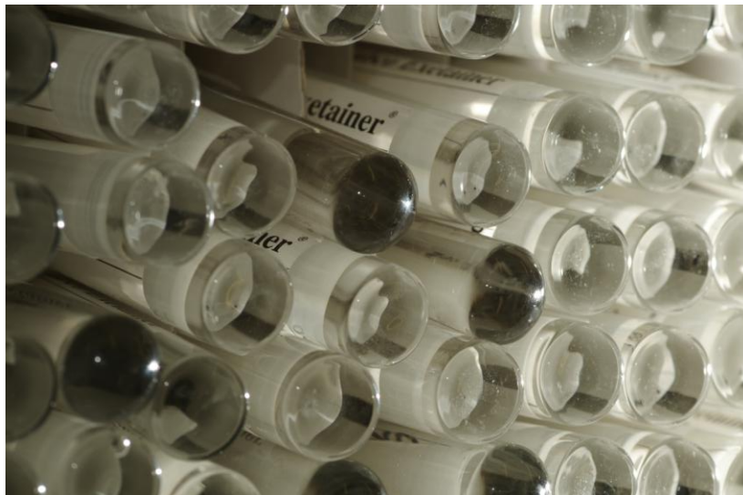
Ende der Probenflut. Die 12 Ansätze umfassende Serie von Inkubationsexperimenten, durchgeführt im Rahmen des BIOACID-Projekts, wurde erfolgreich abgeschlossen.

Kaum von diesen externen Gegebenheiten beeinflusst hat ein anderes wissenschaftliches Großprojekt das Bord- – und insbesondere das Laborleben mitbestimmt. Die insgesamt zwölf am 4. Juli angesetzten Inkubationsexperimente zur Entwicklung und Funktion der Cyanobakterien und weiterer bakterieller Organismen in Abhängigkeit von Phosphatgehalt und CO 2 -Partialdruck wurden am 15. Juli plangemäß beendet. Alle zwei Tage erfolgten Messungen der Nährstoffparameter, des Kohlenstoffsystems, der Respirations- und Stickstofffixierungsraten; dazu Messungen der Phosphatase-Enzymaktivität. Dabei zeigten sich in den pCO 2 - und PO 4 3- -reichen Ansätzen die höchsten Produktionsraten. Im „natürlichen“-Ansatz hingegen überstieg die Respiration eindeutig die Produktion, mit nachweisbarer Bildung von Nitrat und einer Zunahme des CO 2 -Partialdrucks. In keinem der Experimente schien der Phosphatmangel so hoch, dass vermehrt Enzyme zur Spaltung organischer Phosphorverbindungen gebildet wurden. Ein mit Spannung erwartetes Ergebnis kann aber erst an Land nachgereicht werden – ob die veränderten Randbedingungen Einfluss auf die Bildung von Toxinen haben könnten.